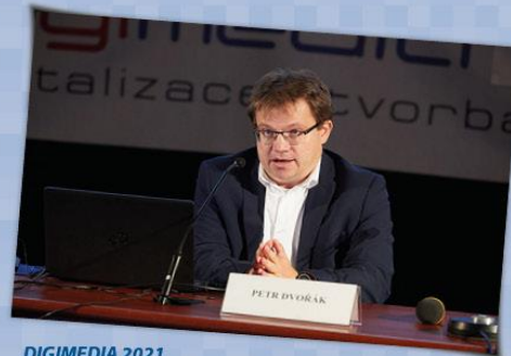
DIGIMEDIA 2021 Petr Očko, náměstek pro digitalizaci MPO