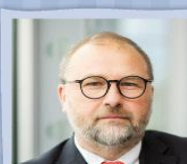
Petr Mrzena Česká televize ředitel zpravodajství

„Inovace v digitálních službách: AI jako most k efektivnějšímu a přístupnějšímu mediálnímu obsahu pro každého. V éře digitalizace jsme s AI na prahu revoluce ve způsobu, jakým distribuujeme mediální obsah, zatímco zachováváme etické standardy a transparentnost v každém kroku naší digitální transformace.“