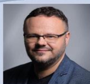
René Zavoral Český rozhlas generální ředitel

„Prostor pro malé české televize se stále zmenšuje. Financování je rébus, jehož řešením již není pouze klasická reklama.“