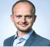
Michal Šašek Ministerstvo kultury náměstek pro audiovizí

„Digitální transformace nám pomáhá udržet krok s dobou a zvyšuje naši konkurenceschopnost.“