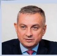
Jozef Síkela Ministerstvo průmyslu a obchodu ministr

„Digitální transformace nám pomáhá udržet krok s dobou a zvyšuje naši konkurenceschopnost.“