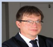
Petr Očko Ministerstvo průmyslu a obchodu vedoucí oddělení strategie

„Umělá inteligence už je nyní klíčovým faktorem digitálního rozvoje České republiky.“